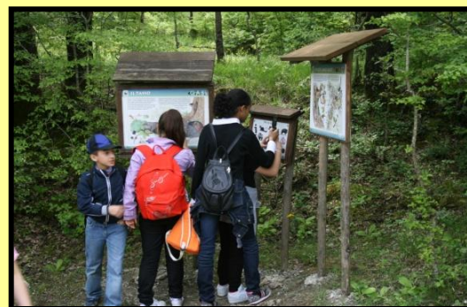
Sentiero Natura "San Nicola"